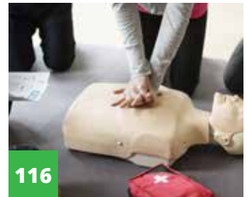
Digitale leeroplossingen Cursussen