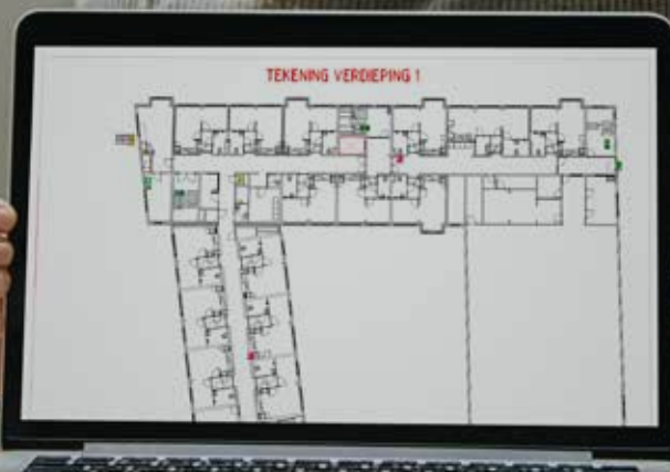
Table-top oefening online

Je kennis over ontruimen op peil houden met een digitale oplossing.